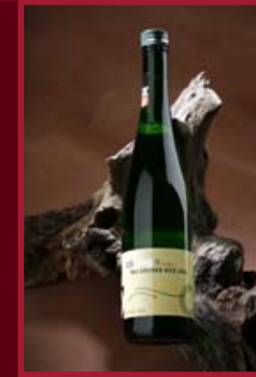
Nové vinařství Drnholec