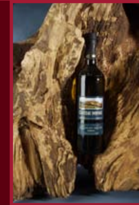
Vinselekt Michlovský Rakvice