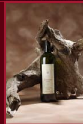
Dobrá vinice Nový Saldorf