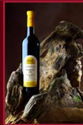
Rod. vinařství Spěvák Velké Bílovice