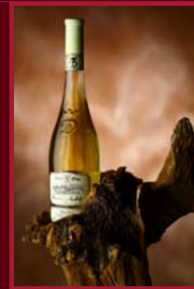
Vinařství u kapličky Zaječí