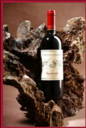
Stapleton Springer Bořetice