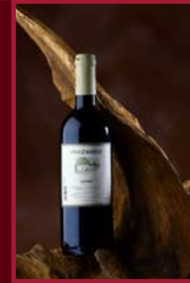
Patria Kobylí Kobylí