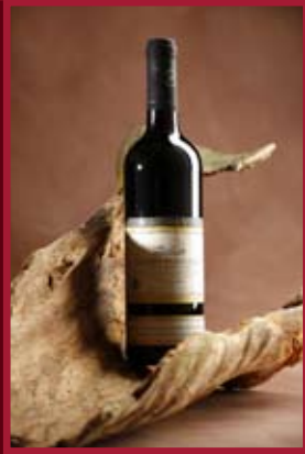
Vinařství Baloun Velké Pavlovice