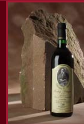
ŠSV Velké Pavlovice