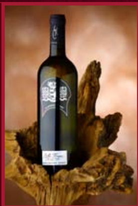
Vinařství Černý Valtice