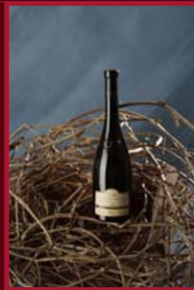
Tanzberg Mikulov - Bavorsky