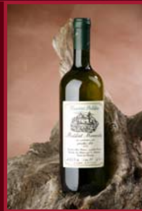
Vinařství Polehňa Blatnice pod sv. Antonínkem