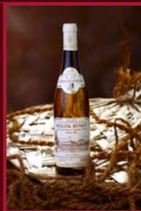
Lobkowiczské vinařství Roudnice nad Labem