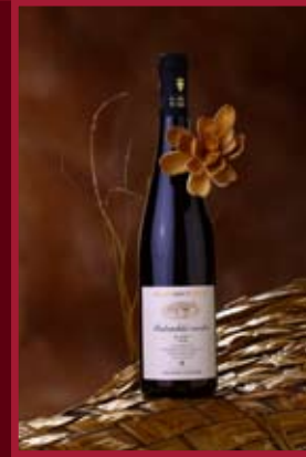
Valtické podzemí Valtice