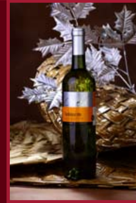
Rod. vinařství Čevela Strážovice