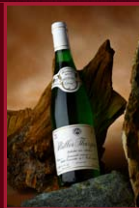
Žemosecké vinařství Velké Žernoseky