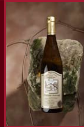
Vinařství Kovacs Novosedly