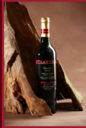
Vinařství V. Tetur Velké Bílovice