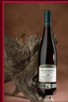
Vinařství rod. Špalkovy Nový Saldorf